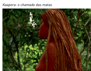
Kaaporá: o chamado das matas