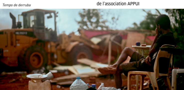
Tempo de derruba