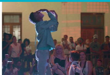
Germino pétalas no asfalto

Avant-première française Jack commence sa transition de genre au moment où le Brésil fait un plongeon conservateur. Même dans l'adversité, Jack et ses amis se créent un réseau d'affection et de solidarité.