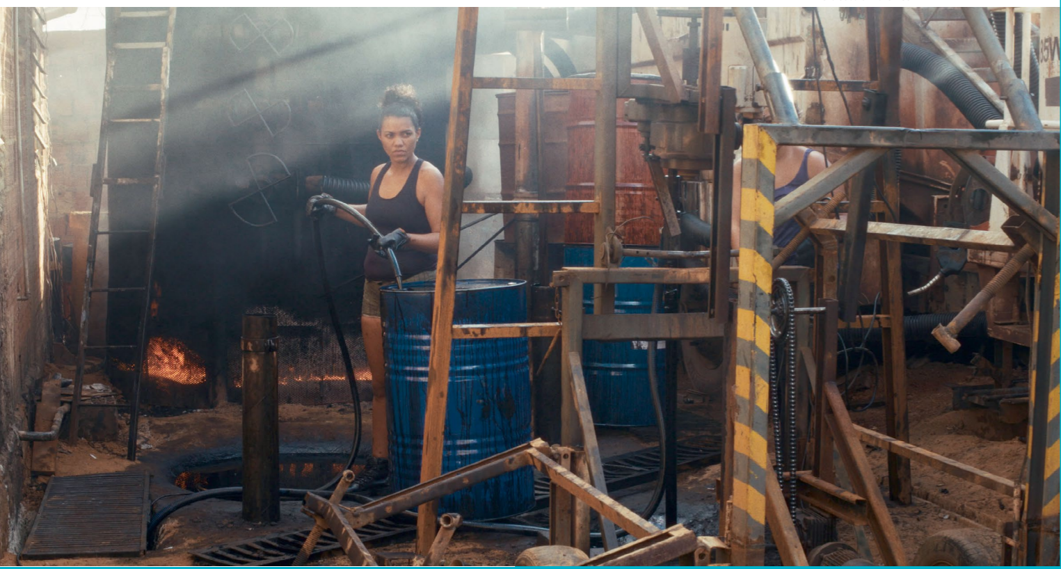
Mato seco em chamas