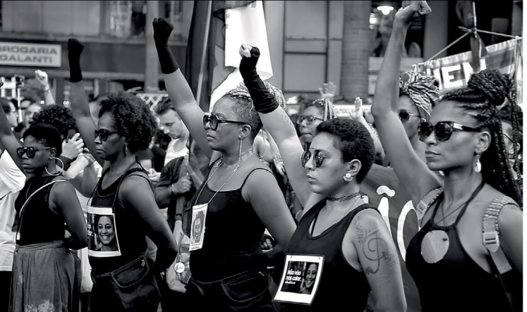
Sementes: mulheres pretas no poder

SEMENTES: MULHERES PRETAS NO PODER Graines : Femmes noires au pouvoir de Ethel Oliveira et Júlia Mariano Brésil | 2020 | 100' Avant-première française En réponse à l'exécution de Marielle Franco, les élections de 2018 se sont transformées en un soulèvement politique mené par des femmes noires. À travers leurs campagnes politiques, le film montre qu'il est possible de transformer le deuil en lutte.